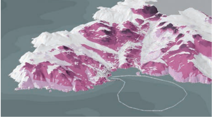
Mapa de tranquilidad del LIC Costa da Morte (Galicia), valorada en tonalidades gradualmente oscuras; en trazos discontinuos aparece la ruta de las romerías marinas.

20. Si la planificación no incluye los elementos del patrimonio inmaterial, desarrollar instrumentos complementarios como planes, estrategias o directrices que permitan incorporar de facto sus valores.