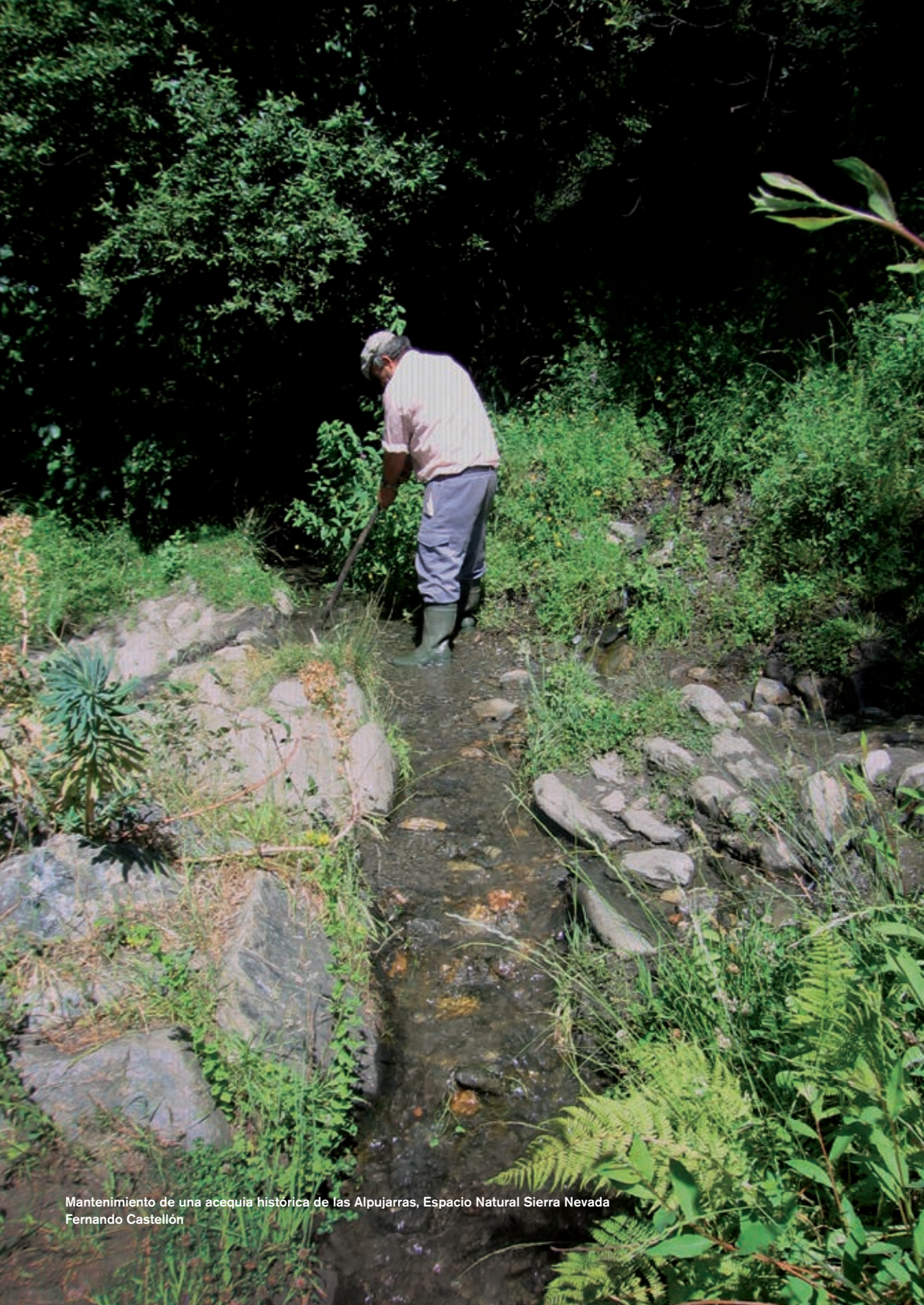
Mantenimiento de una acequia histórica de las Alpujarras, Espacio Natural Sierra Nevada Fernando Castellón