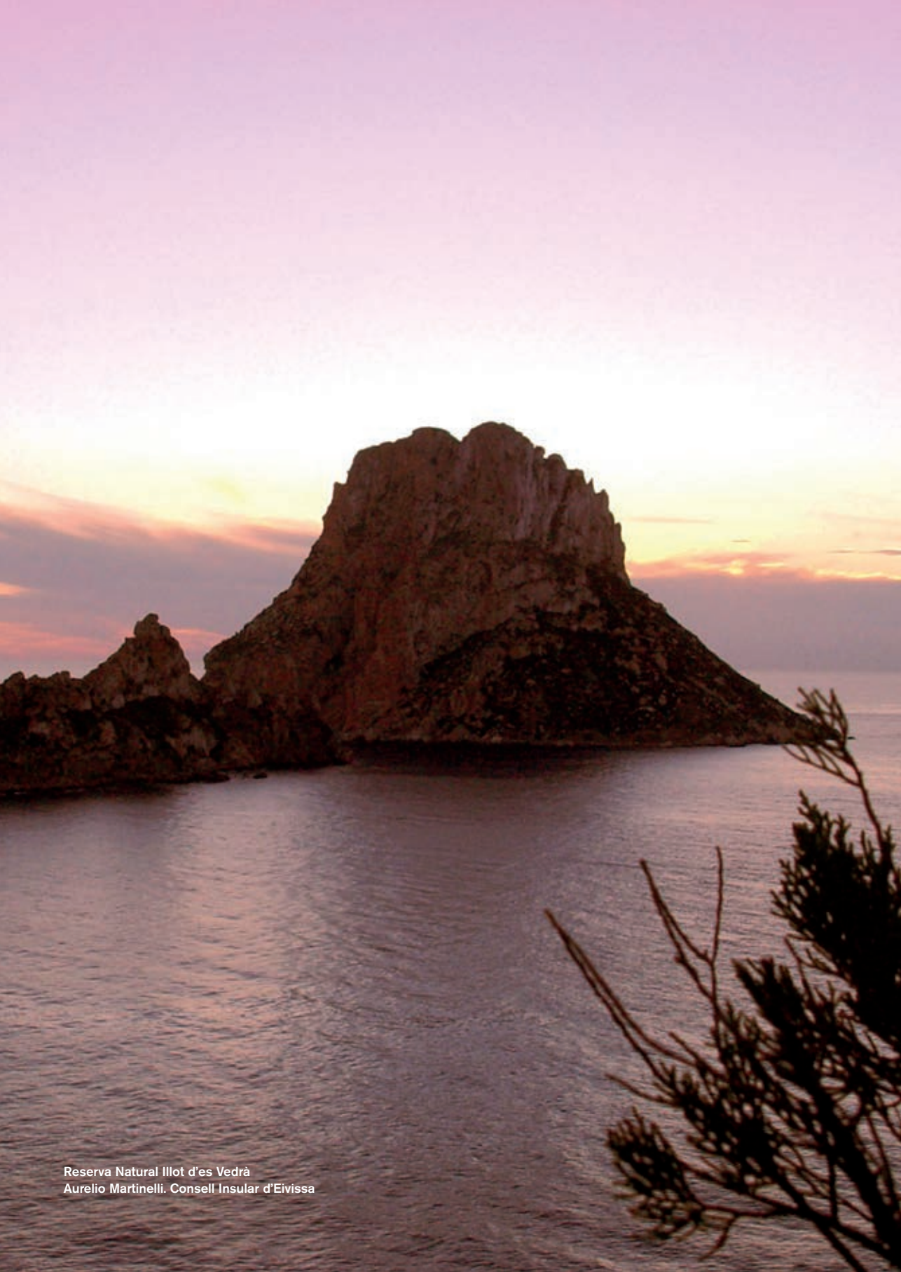
Reserva Natural Illot d'es Vedrà Aurelio Martinelli. Consell Insular d'Eivissa