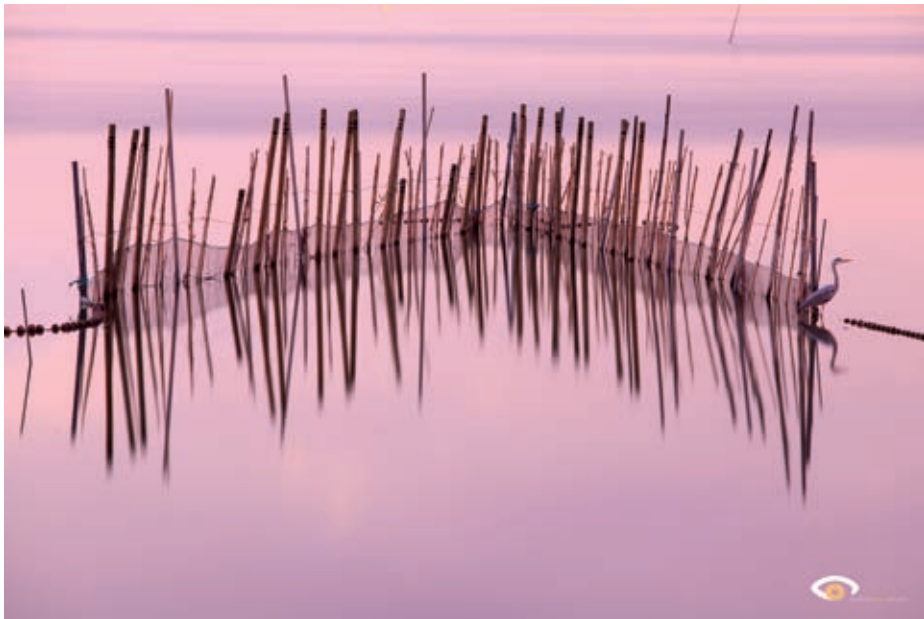
Parque Natural de La Albufera, primer premio de la categoría AEFONA (Asociación Española de Fotógrafos de Naturaleza) del Concurso de Fotografía “Áreas protegidas: reconectando con la naturaleza”.