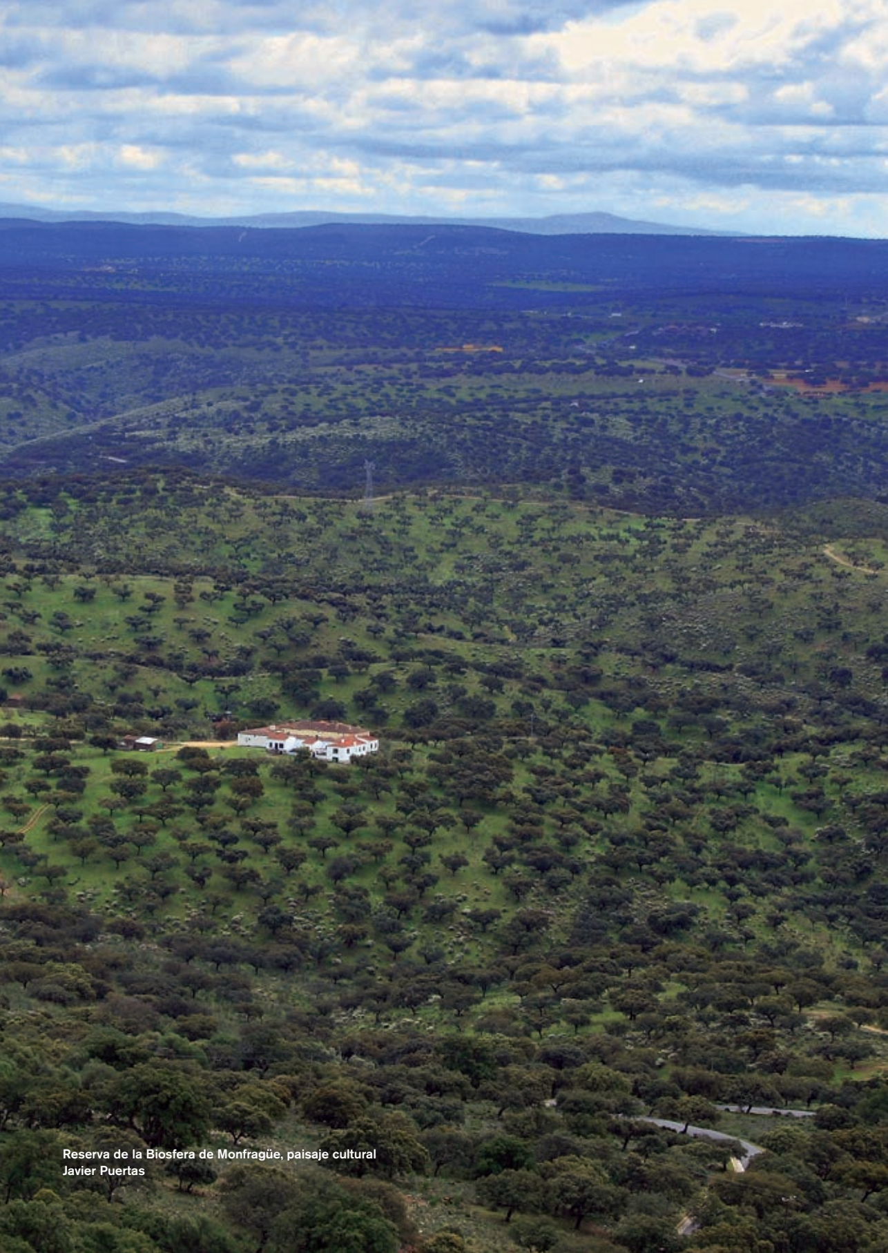
Reserva de la Biosfera de Monfragüe, paisaje cultural Javier Puertas