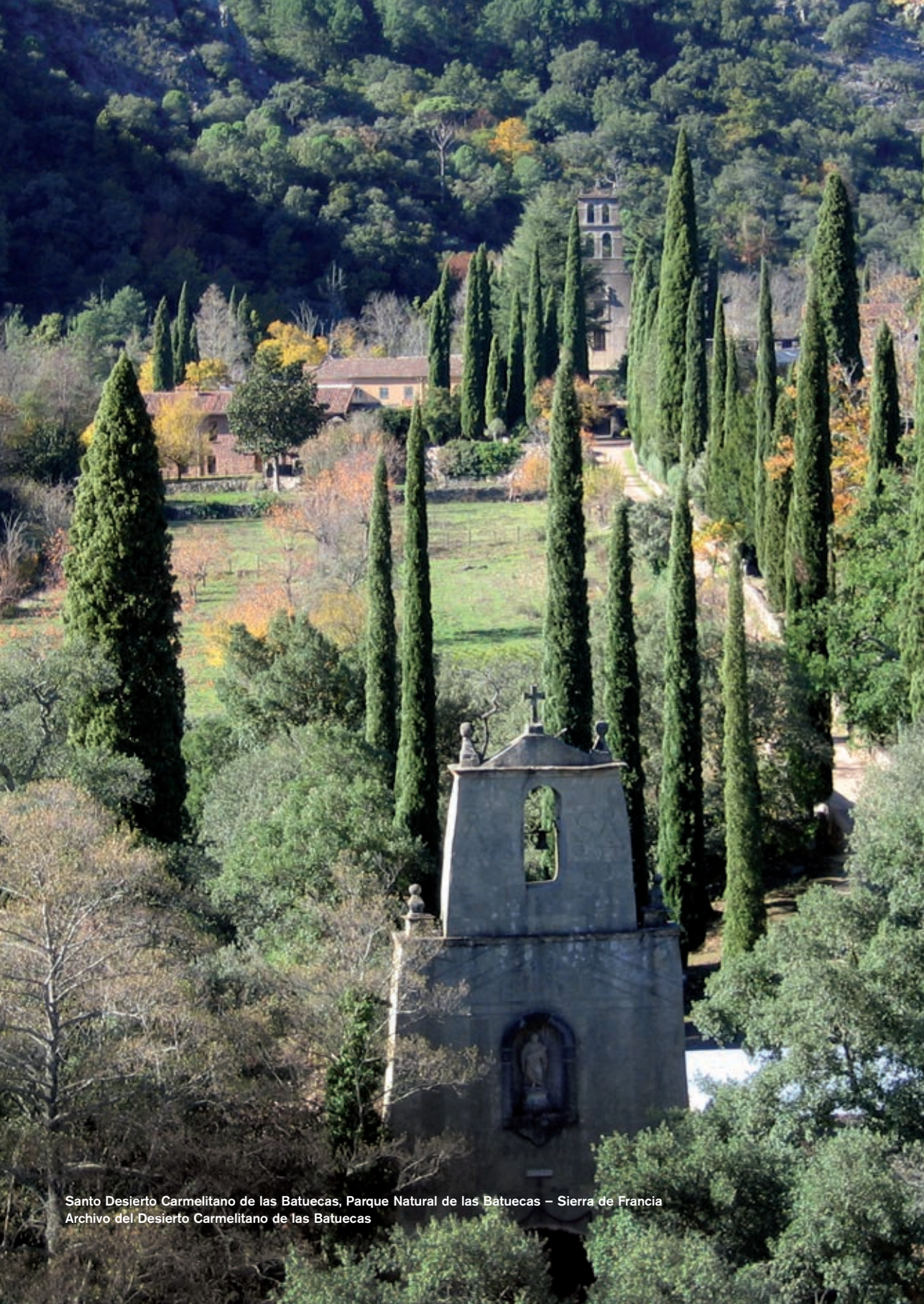
Santo Desierto Carmelitano de las Batuecas, Parque Natural de las Bátuecas – Sierra de Francia