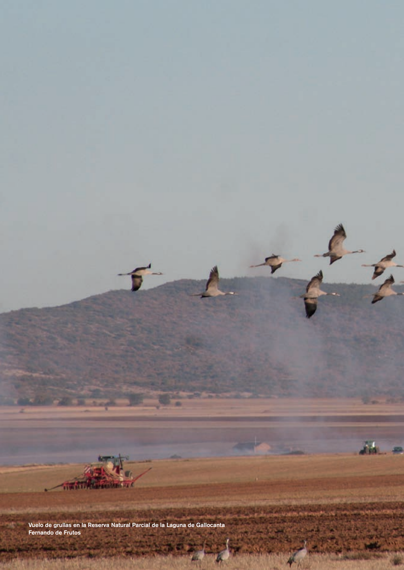
Vuelo de grullas en la Reserva Natural Parcial de la Laguna de Gallocanta Fernando de Frutos